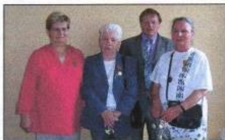
Les récipiendaires de la famille française promotion du 14 juillet 2004

Nous poursuivons notre politique d'amélioration du bâtiment commercial (épicerie, bar , restaurant ) en investissant 3710 € en 2003 et 2660 € en 2004 dans le logement.