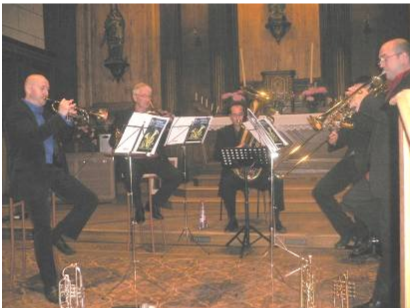
12 mai 2007 : Concert du quintette de cuivres ABC D'AIR à l'église.

- Le Conseil Municipal décide de réviser le tarif de la cantine scolaire de la prochaine rentrée et fixe le prix du repas à 2,41 € pour l'année 2007/2008.