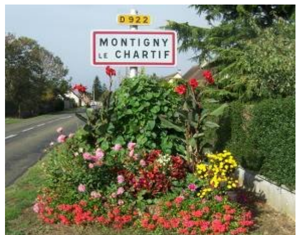
Montigny-Le-Chartif ; commune fleurie