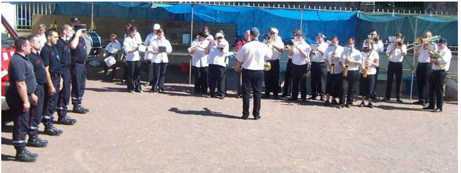
L'« Harmonie de Condé-Sur-Huisne » lors de la revue des pompiers de Montigny-Le-Chartif pendant les festivités du 14 juillet.

randonneur recommandant des consignes de bonne conduite, à savoir :